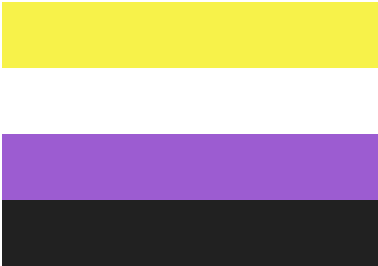
Le drapeau Pride des personnes non binaires