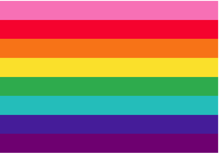
Le premier drapeau Pride par lequel tout a commencé