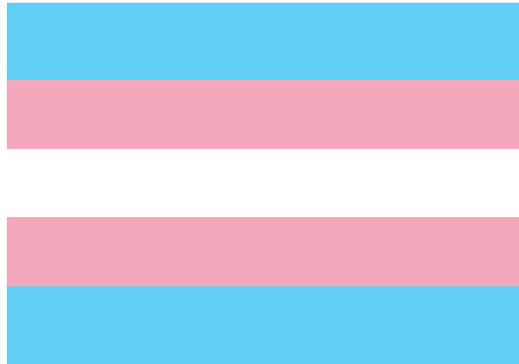
Le drapeau des personnes transgenres