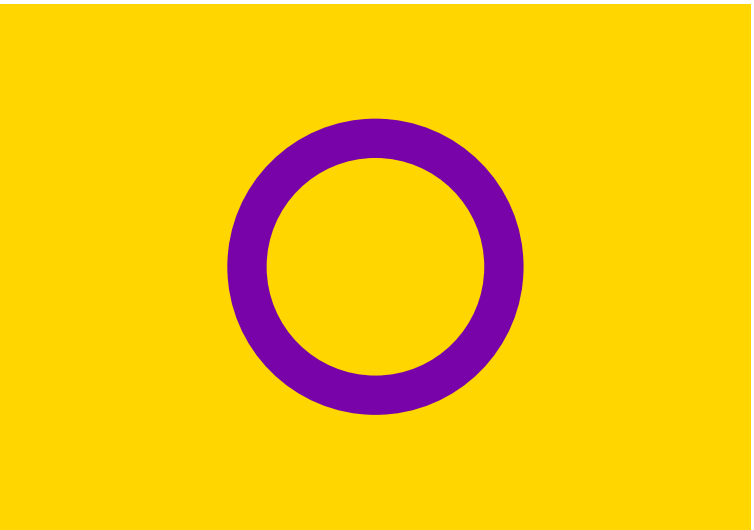
Le drapeau des personnes intersexes