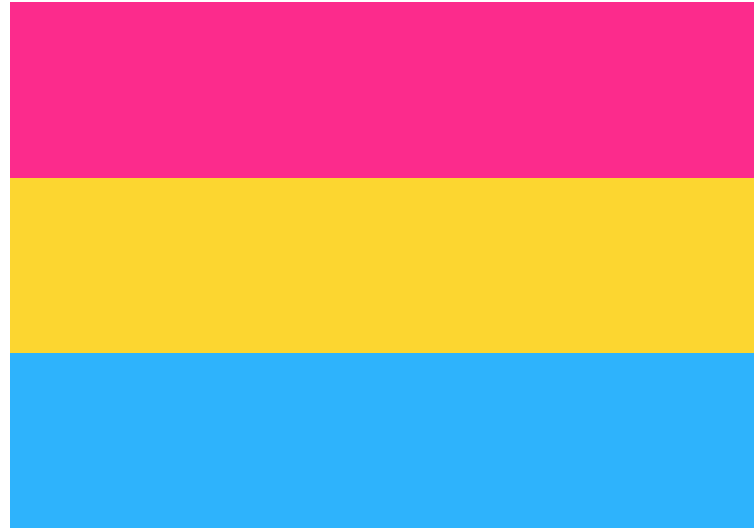
Le drapeau des personnes pansexuelles